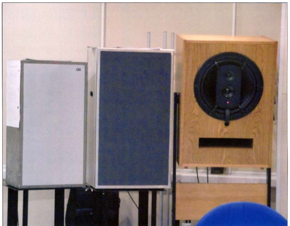
‚Historischer‘ Lautsprecheraufbau im großen Hörraum...